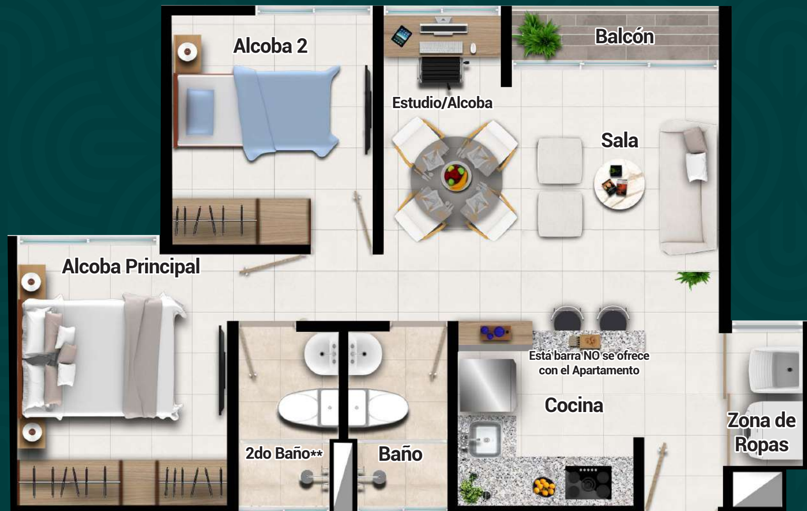
Posible 3ra Alcoba***